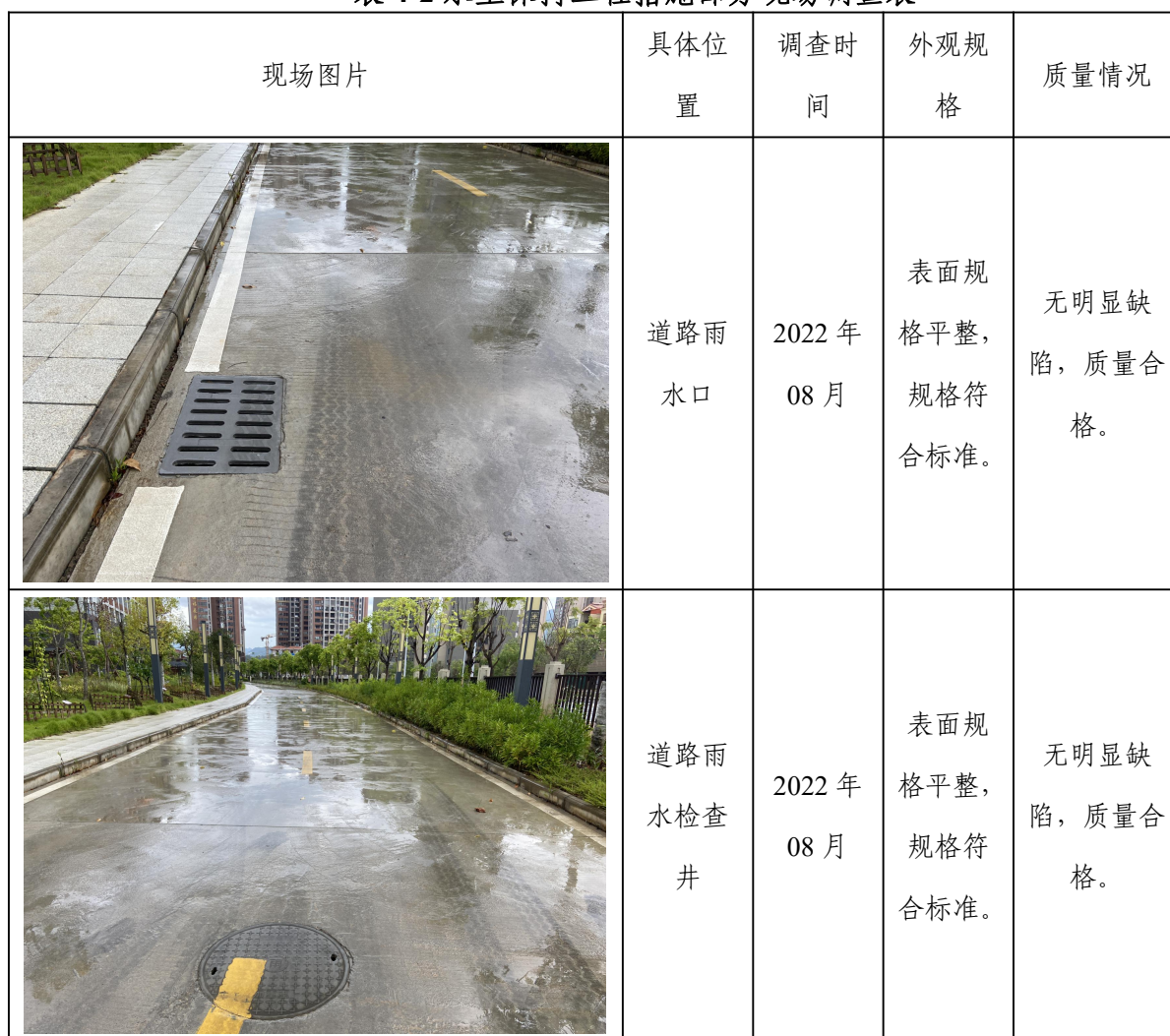
表 4-2 水土保持工程措施部分现场调查表

产品至成品质量合格，建筑物结构尺寸规则，外表整齐，质量符合设计和规范的要求，工程措施质量总体合格。水土保持工程措施部分现场调查见表 4-2。