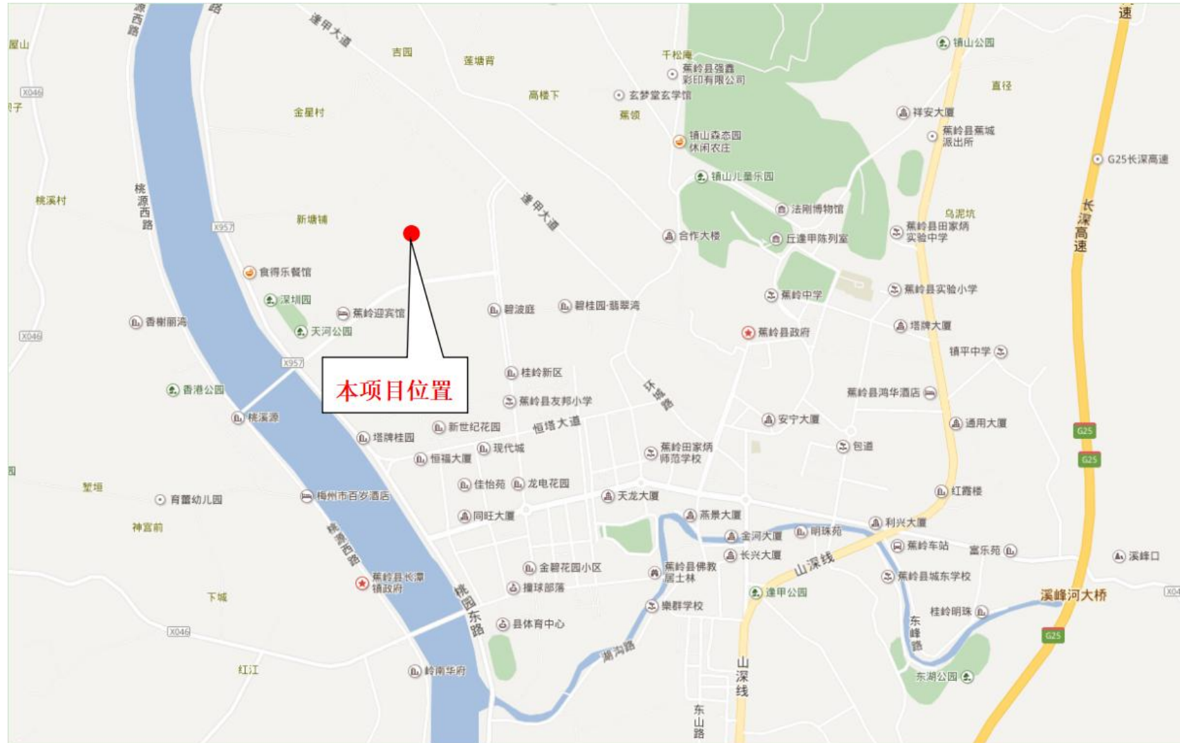
附图 1：项目地理位置图