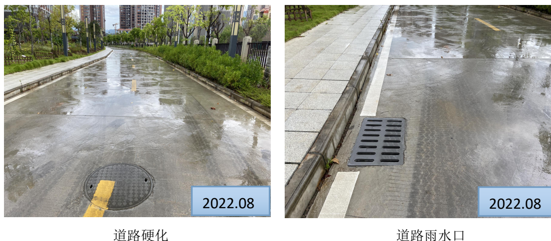
图 3-1 水土保持工程措施照片