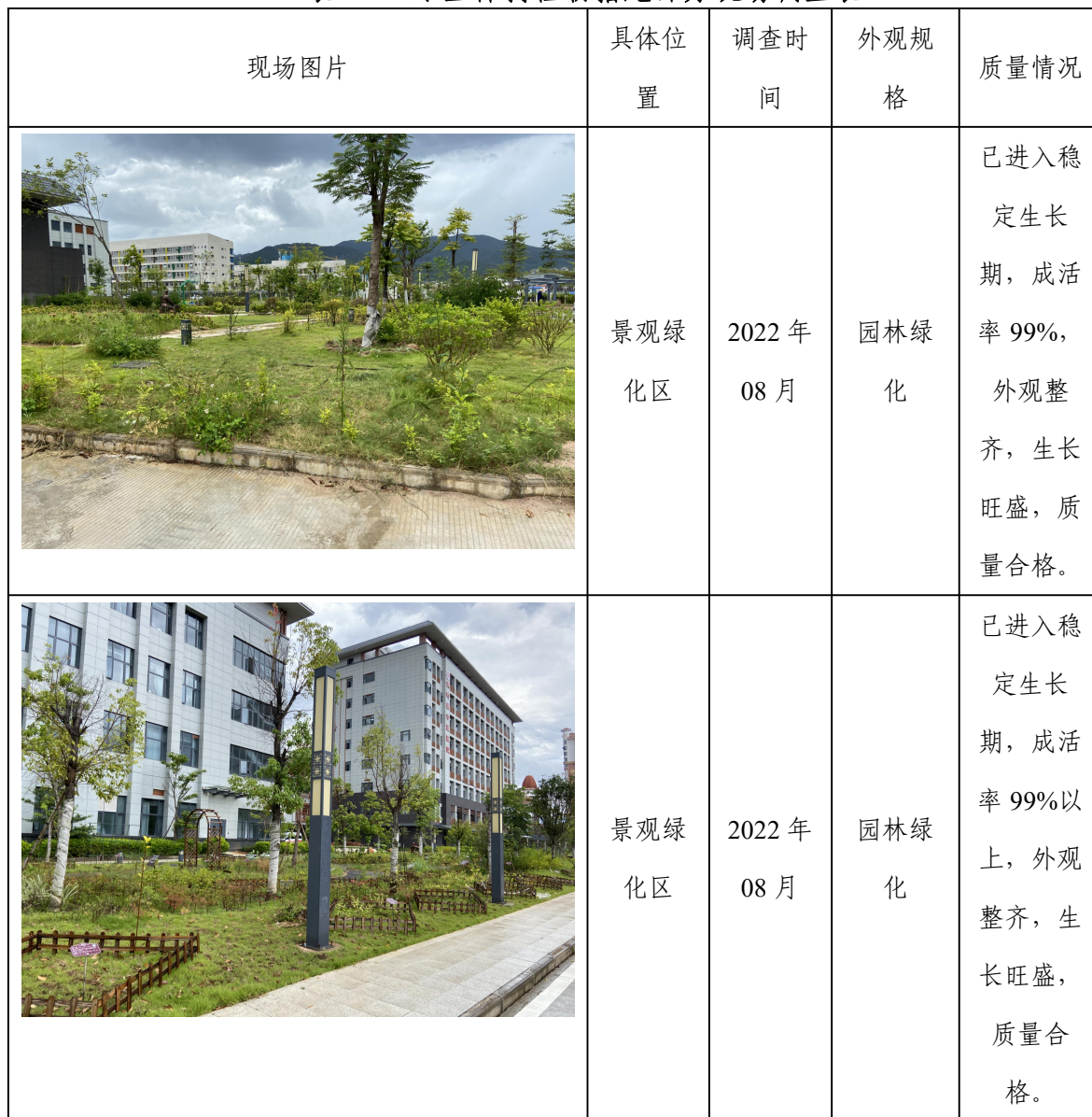
表 4-4 水土保持植物措施部分现场调查表

按照验收范围、验收内容，采用上述自验方法，对工程植物措施实施情况进行现场调查，建设区内植物措施面积基本采取了全查的核对方式。部分现场调查情况见表 4-4。