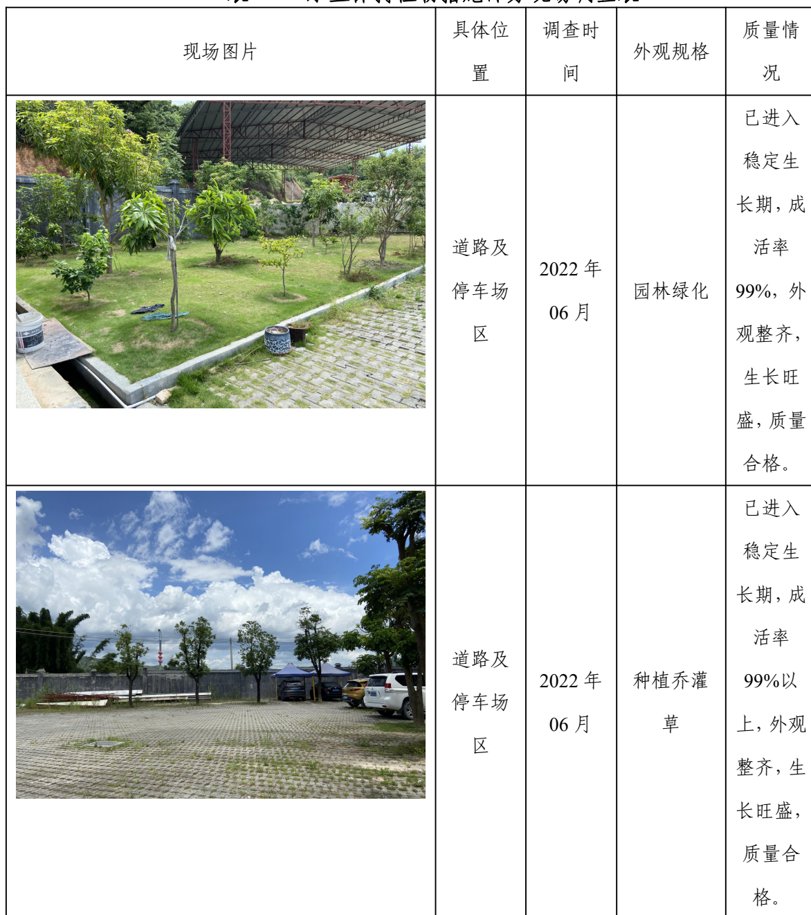
表 4-4 水土保持植物措施部分现场调查表