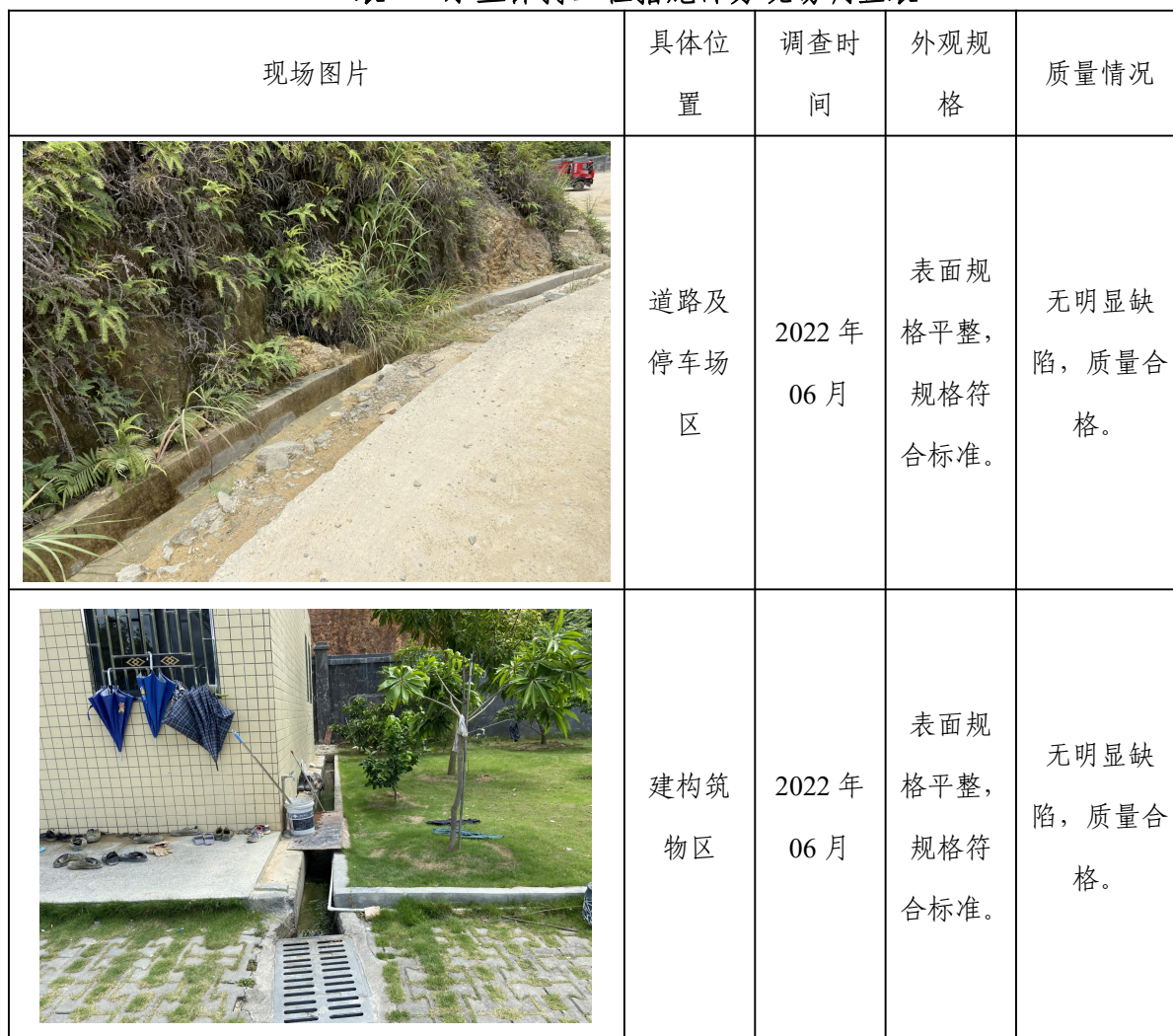
表 4-2 水土保持工程措施部分现场调查表