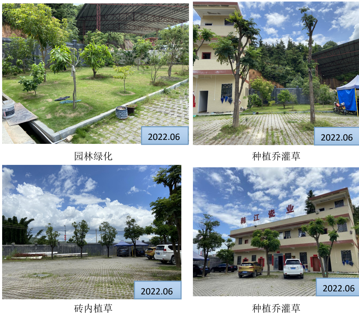
图 3-3 水土保持植物措施照片