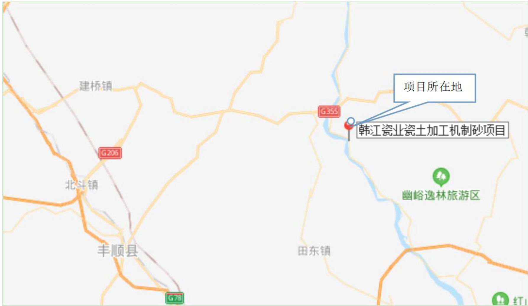
附图 1：项目地理位置图