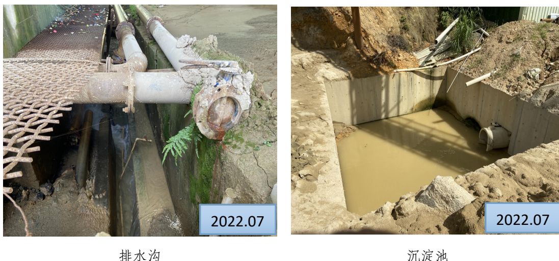
图 4-1 水土保持工程措施现状