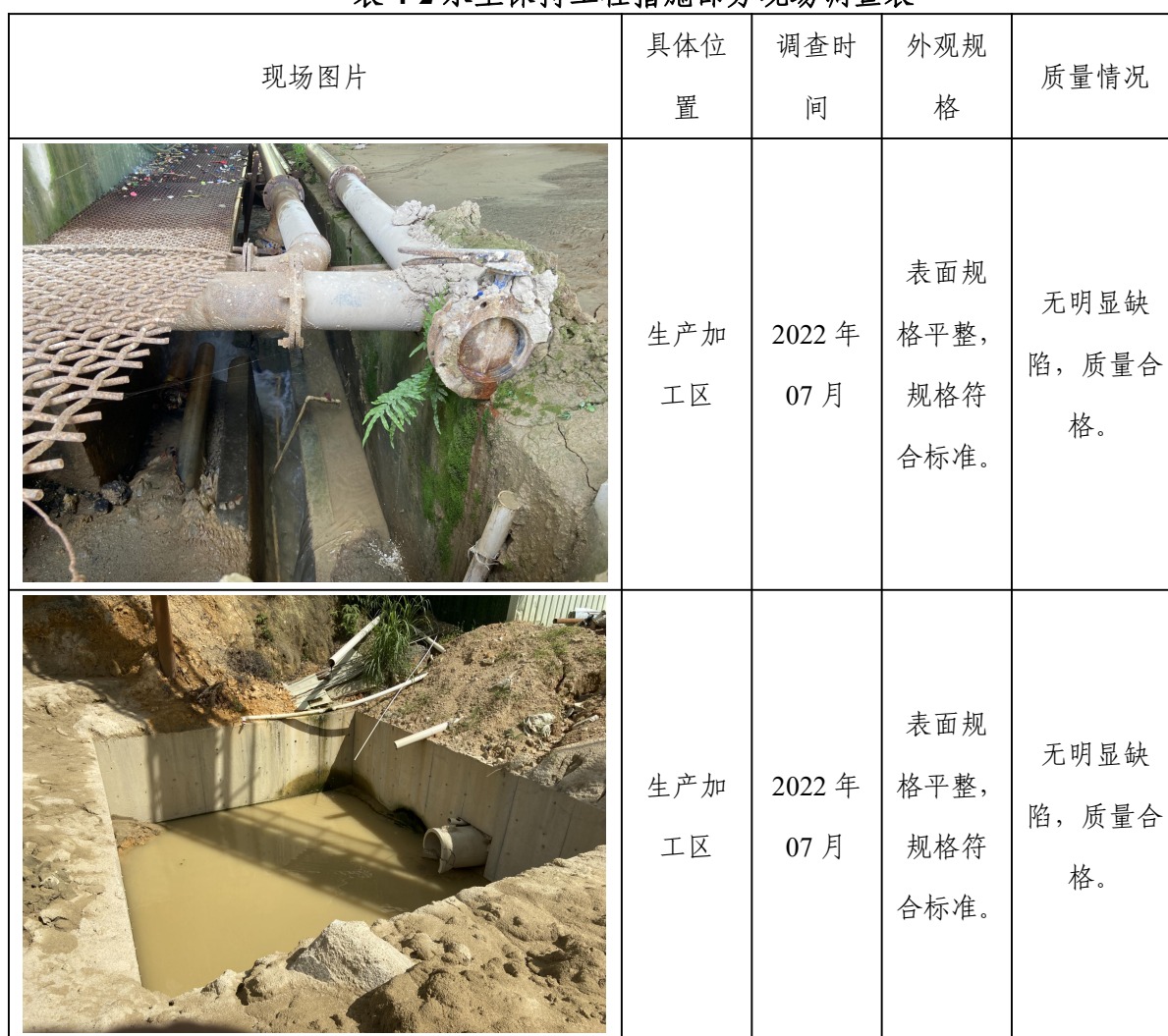
表 4-2 水土保持工程措施部分现场调查表

现场抽查工作的重点是排水工程等水土保持工程措施，检查其工程外观形状、轮廓尺寸及缺陷等。综合资料查阅和现场检查的结果，评估组认为：本工程建设过程中将水土保持工程措施纳入主体工程施工之中，水土保持建设与主体工程建设同步进行，质量保证体系完善。对进入工程实体的原材料和中间产品、成品进行抽样检查、试验，对不合格材料严禁使用，有效地保证了工程质量。水土保持工程措施从原材料、中间产品至成品质量合格，建筑物结构尺寸规则，外表整齐，质量符合设计和规范的要求，工程措施质量总体合格。水土保持工程措施部分现场调查见表 4-2。