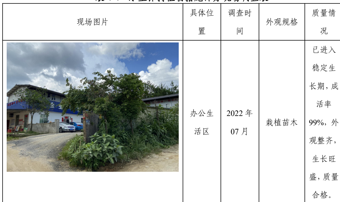
表 4-4 水土保持植物措施部分现场调查表

按照验收范围、验收内容，采用上述自验方法，对工程植物措施实施情况进行现场调查，建设区内植物措施面积基本采取了全查的核对方式。部分现场调查情况见表 4-4。